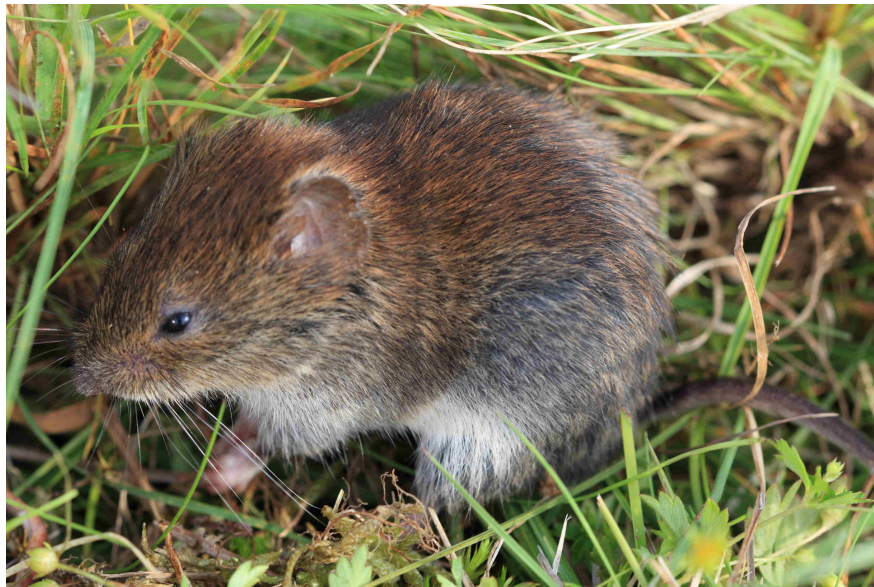
Afbeelding 9: Rosse woelmuis gevangen nabij Korverskooi.