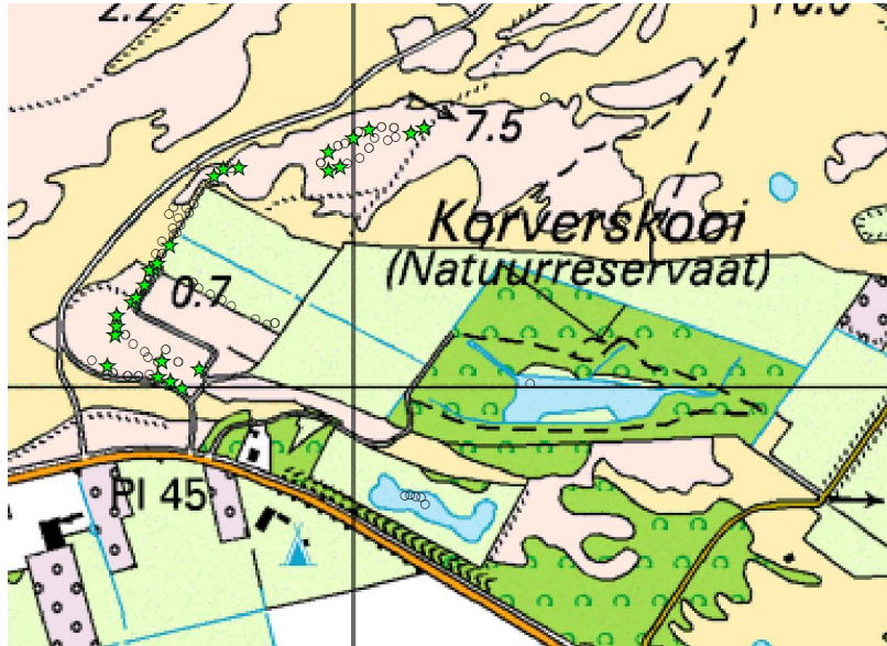
Afbeelding 8: Overzicht vanglocaties (0) en vangplekken (ster) rosse woelmuis.

Met één op de drie is de rosse woelmuis de meest algemeen gevangen soort (32,6%). De enige raaien waar de rosse woelmuis niet zijn gevangen zijn raai 3 en 8. Kenmerkend voor deze raaien, ten opzichte van de overige zes raaien, is dat de vegetatie hier veelal grazig is terwijl de vangplekken gekenmerkt worden door struweel met beperkte grazige ondergroei.