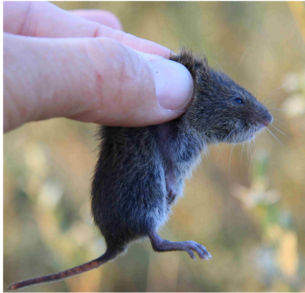
Afbeelding 12: Jonge noordse woelmuis gevangen op noordhelling van duin nabij Korverskooi.

Grietjesplas was ten tijden van het veldonderzoek nagenoeg volledig drooggefallen. De vegetatie wordt gekenmerkt door ijl riet met een ondergroei van veenmos en kruiden. De losse vangst (de vallen zijn niet gepre-bait) van een volwassen noordse woelmuis impliceert dat dit geschikt leefgebied is voor de noordse woelmuis.