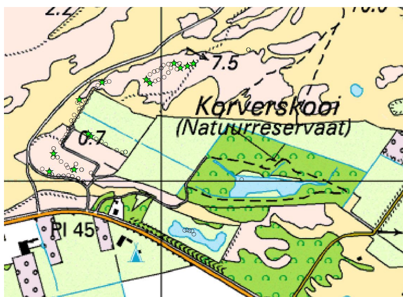
Afbeelding 10: Overzicht vanglocaties (0) en vangplekken (ster) aardmuis.

Met uitzondering van raai zes is de aardmuis in vrijwel elke raai gevangen. Van alle muizen betrof 15,2 % deze soort. In raai 1 en 2 (gelegen in de te plaggen vallei aan de noordzijde van het studiegebied) kwam de aardmuis min of meer naast de rosse woelmuis en de noordse woelmuis voor. In raai 3, gelegen op het grensvlak tussen begraasde wei en heideveld, was de aardmuis de enige aangetroffen woelmuis soort. In raai 4 werd de aardmuis aangetroffen in de iets grazige delen van het kruipwilgenstruweel. In raai 5 werden de aardmuizen aangetroffen in het, iets Grazigere, middengedeelte. Zowel in raai 7 als 8 werd slechts één aardmuis gevangen. In beide gevallen betroffen het droge dichte helmgrasvegetatie.