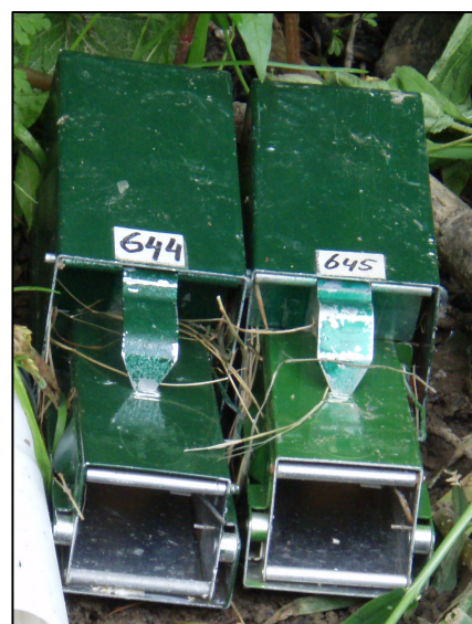
Afbeelding 2: Longworth inloopvallen

In het kader van dit onderzoek is gevangen op acht locaties (zie figuur 1). Elke vangplek