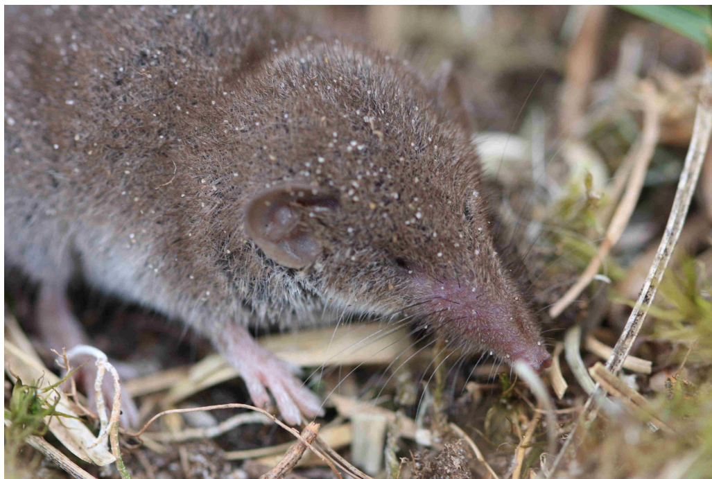
Afbeelding 3: Huisspitsmuis in droge duin nabij Korverskooi.

In totaal werden zeven huisspitsmuizen gevangen, 5% van alle vangsten. Niet alleen werd de huisspitsmuis gevangen nabij het woonhuis van dokter De Witte, maar ook in het droge duin (raai 8, tussen helmgras) gelegen tegen het fietspad, op de grens tussen het duin met struikheide en het te chopperen weiland (raai 7) evenals in dit weiland (raai 3).