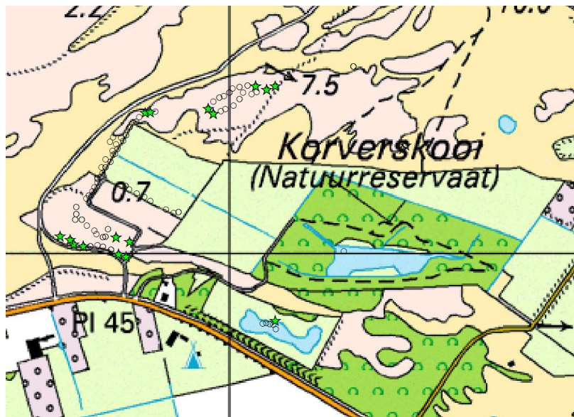
Afbeelding 11: Overzicht vanglocaties (0) en vangplekken (ster) noordse woelmuis.

impliceert dat hier mogelijk sprake is van minder optimaal geschikt habitat met immigratie uit de nabije omgeving.