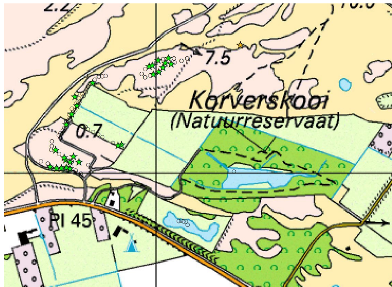
Afbeelding 6: Overzicht vanglocaties (0) en vangplekken (ster) bosmuis.