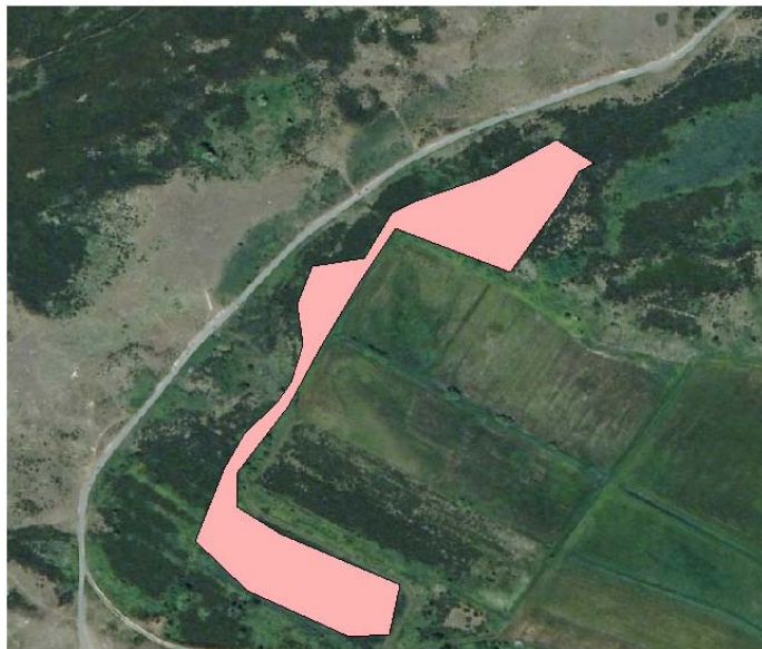
Figuur 1: Overzicht van het te plaggen gedeelte van het terrein. Rechtsonder het te plaggen vlak ligt de Korverskooi. Links van het te plaggen gebied ligt het fietspad (Zanddijk) dat loopt van de Ruigendijk tot aan de Krimweg.

Staatsbosbeheer is voornemens om, in navolging van in De Nederlanden (Koelman 2008), ten noordwesten van de Korverskooi, een deel van hun terrein (met een oppervlakte van ca. 1 ha; zie onderstaande figuur) te plaggen. Het gaat in hoofdzaak om ruig terrein met kruipwilg en struikheide, met daarnaast een ruige grasvegetatie.