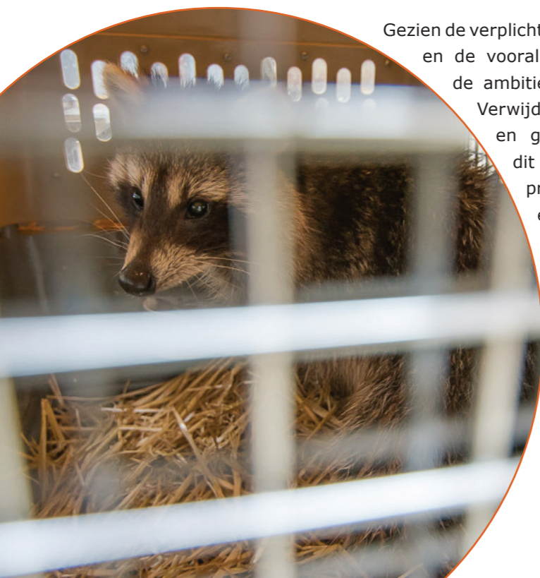
Figuur 1. Een wasbeer in een transportkist, gevangen door het professionele vangteam in Limburg.

Gezien de verplichtingen die gelden vanuit de Europese Exotenverordening en de voorsnog beperkte verspreiding van de wasbeer, is het de ambitie van de Rijksoverheid om een nulstand te krijgen. Verwijdering van de wasberenvolpopulatie bij een langdurige en gecoördineerde aanpak wordt door de overheid op dit moment nog als haalbaar ingeschat, al zal dat in de praktijk neerkomen om het trachten te bereiken van een zo laag mogelijke dichtheid. Sinds 2024 wordt de wasbeer bestreden in Limburg door een professioneel vangteam. Daarbij is het Wasberenmeldpunt een belangrijk hulpmiddel. Ook kunnen wasberen door jagers worden geschoten.